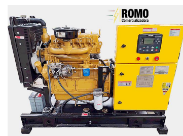
De tipo abierto