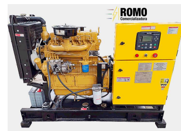
De tipo abierto