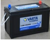
⑧ Batería de arranque