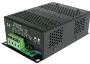
⑨ Cargador de batería