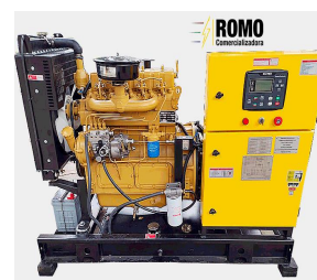
De tipo abierto