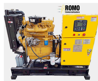
De tipo abierto