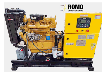
De tipo abierto