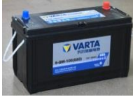
⑧ Batería de arranque