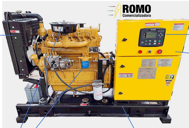
① Panel de control automático