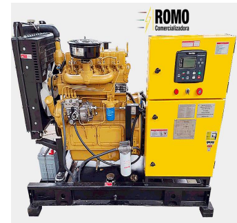
De tipo abierto