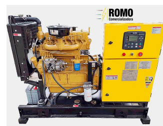
De tipo abierto