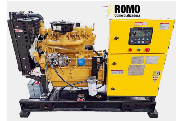
De tipo abierto