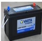
⑧ Batería de arranque