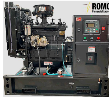
De tipo abierto