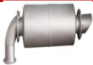
⑦ Silenciador de escape