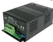
⑨ Cargador de batería