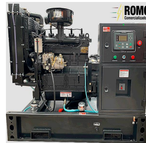
De tipo abierto